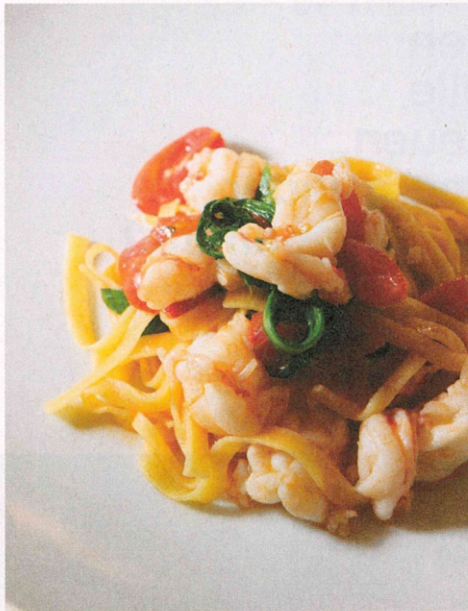
● Hausgemachte Pasta mit frischen Langostinos – so geht Pasta!

In zwei Jahren feiert ihr mit 30 Jahren Dolce Vita ein bemerkenswertes Jubiläum. Obwohl du noch sehr energiegeladener und lebensfroher wirkst, wird auch dein Berufsleben irgendwann zu Ende gehen. Wie wird es mit dem Dolce Vita weitergehen?