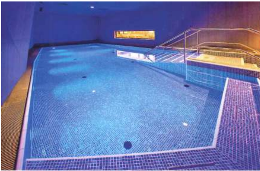
Im stimmungsvoll beleuchteten, warmen Solebecken können die Gäste die Seele baumeln lassen.

können die Gäste dort ein eindrucksvolles Berg- und Stadtpanorama genießen.