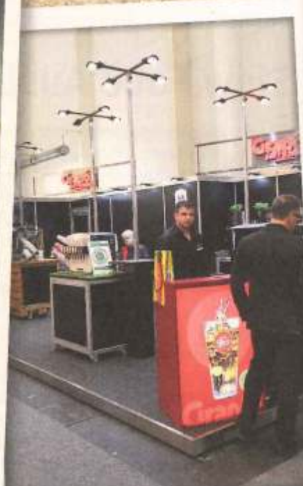
Schanntechnik-Profi Grapos präsentierte seine Gastro-Lösungen ebenfalls auf der Messe. Vor allem der niedrig CO2 Fußabdruck von Post-Mix-Anlagen war ein wichtiges Thema. www.grapos.com