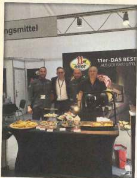
Auch der heimische Kartoffelspezialist 11er ließ es sich nicht nehmen, seine Produkte für Gastronomie und Gemeinschaftsverpflegung in der Hansestadt vorzustellen. www.11er.at