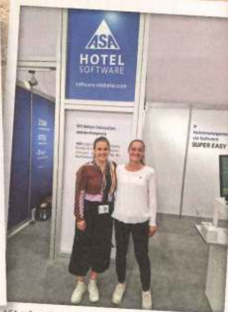
ASA präsentierte seine Software-Lösungen, etwa den Check-in Manager, mit dem Daten von Ausweisen, Führerscheine oder Reisepässe schnell und einfach eingescannt werden können. www.asahotel.com