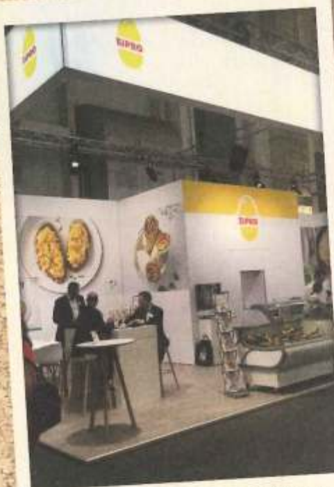
Am Stand von Eipro stand vor allem die Präsentation des neuen pflanzenbasierten Ei-Alternativproduktes unter dem Namen „høgg“ und des Bio Omeletts im Fokus. www.eipro.de