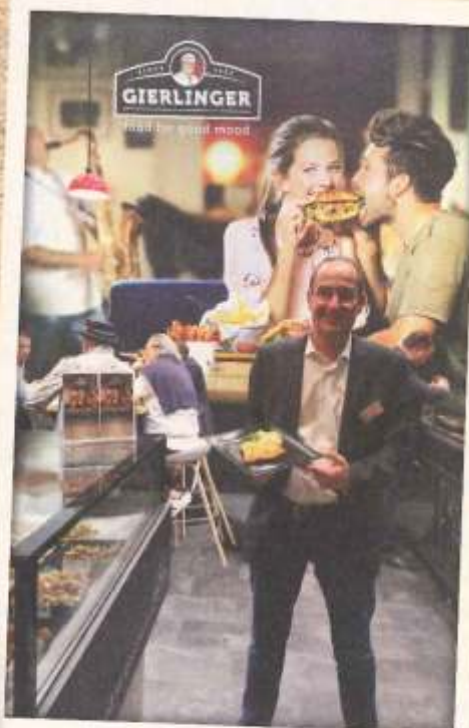
„Convenience wie hausgemacht“ lautet der Slogan von Gierlinger, wovon sich die Messebesucher bei zahlreichen Fleischprodukten, Wurst- und Schinkenspezialitäten überzeugen konnten. www.gierlinger-holding.com