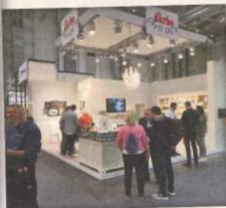
Fruchtig ging es auf dem Messestand von Darbo zu. Egal ob Marmeladen, Sirupe oder Honig in unterschiedlichen Varianten, bis hin zum Fruchtaufstrich in der 4,5-kg-Dose. b2b.darbo.at/de